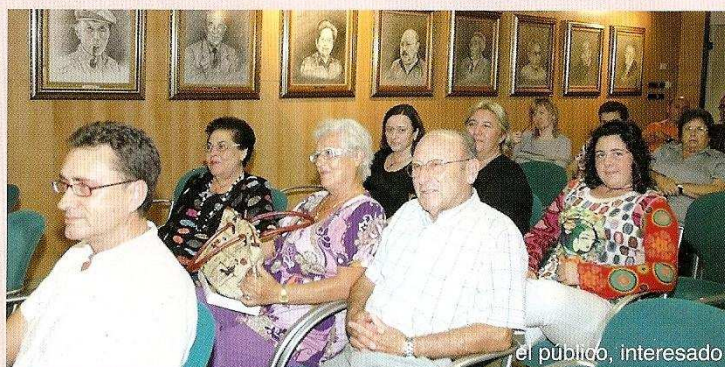
el público, interesado